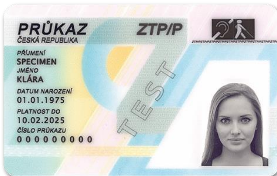
Obr. 3 – Průkaz ZTP